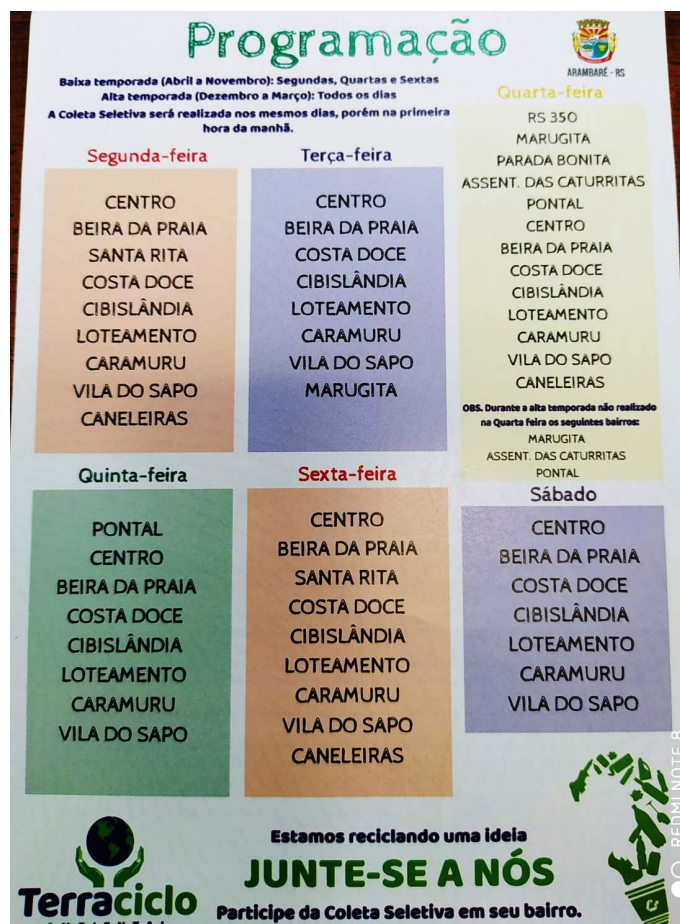
Imagem 1: Mostra o folder atual com o roteiro da coleta

Os serviços necessários para a execução do saneamento ambiental relativo à limpeza urbana, estão descritos a baixo: